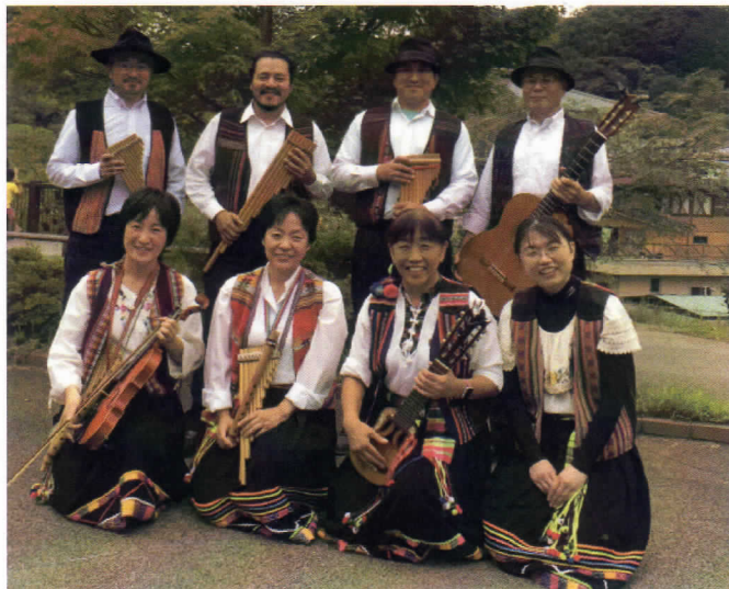
「グループ・パンカリータス」による演奏