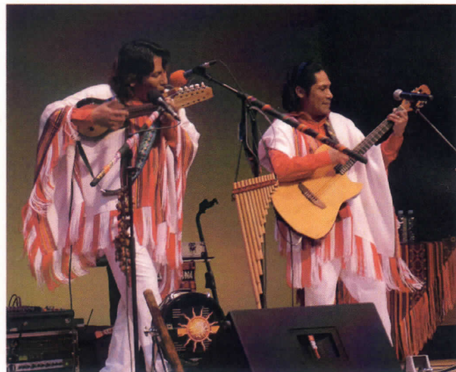
「カルパンディーナ KALLPANDINA」による演奏