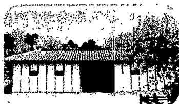
吟子の生家(長屋門)