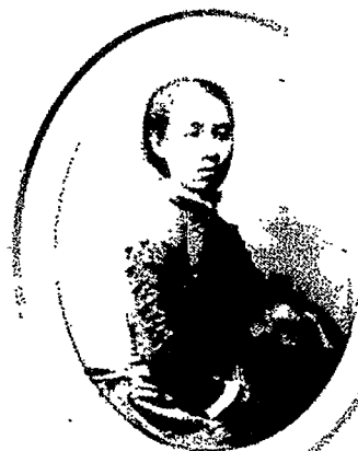
鹿鳴館スタイル 熊谷で撮影