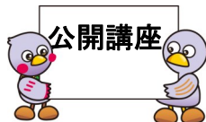
埼玉県マスコット 「さいたままっちゃん&コバトン」