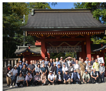
一之宮貫前神社総門前にて

秋の空、本殿拝殿に下る階段96段を数えて参拝、こしね汁付き昼食、周辺の山々を借景に紅葉の始まる大名庭園の散策などを楽しみました。